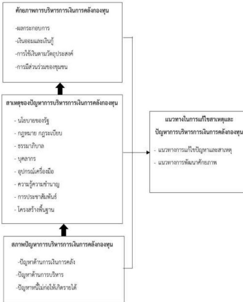
ภาพที่ ๑ กรอบแนวคิดการวิจัย

จากกรอบแนวคิดที่ใช้ในการศึกษาเริ่มจากการศึกษาสภาพปัญหาที่เกิดขึ้นในด้านการเงินการคลัง การบริหารจัดการ และหนี้ที่ไม่ก่อให้เกิดรายได้ต่างๆ จะนำไปสู่การค้นหาสาเหตุของปัญหาเหล่านั้นในด้านต่างๆ ทำให้สามารถประเมินและอธิบายศักยภาพความสามารถของกองทุนหมู่บ้านได้ และเป็นแนวทางให้ผู้วิจัยกำหนดวิธีการในการแก้ไขสาเหตุของปัญหาต่างๆ และเสนอแนะแนวทางในการพัฒนากองทุนหมู่บ้านเพื่อให้มีศักยภาพสูงสุดในการบริหารจัดการกองทุนให้มีประสิทธิภาพ บรรลุวัตถุประสงค์และเจตนารมณ์ของการจัดให้มีกองทุนหมู่บ้านและชุมชนเมืองตามที่พระราชบัญญัติกองทุนหมู่บ้านและชุมชนเมืองได้ระบุไว้